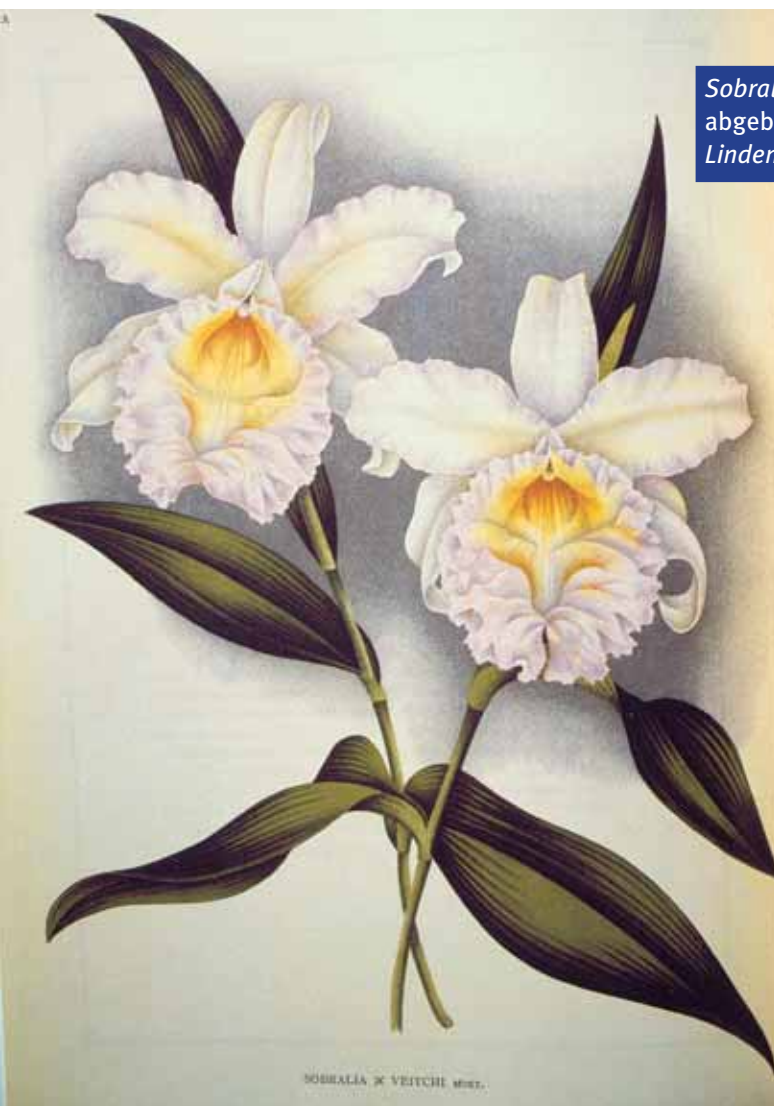
Sobralia Veitchii abgebildet in / illustrated in Lindenia (t. 740)

So the name Sobralia Veitchii is tagged to a naturally occurring hybrid even though all historic records of the name actually refer to a different hybrid parentage. The vagaries of taxonomy when working with such a horticulturally important group.