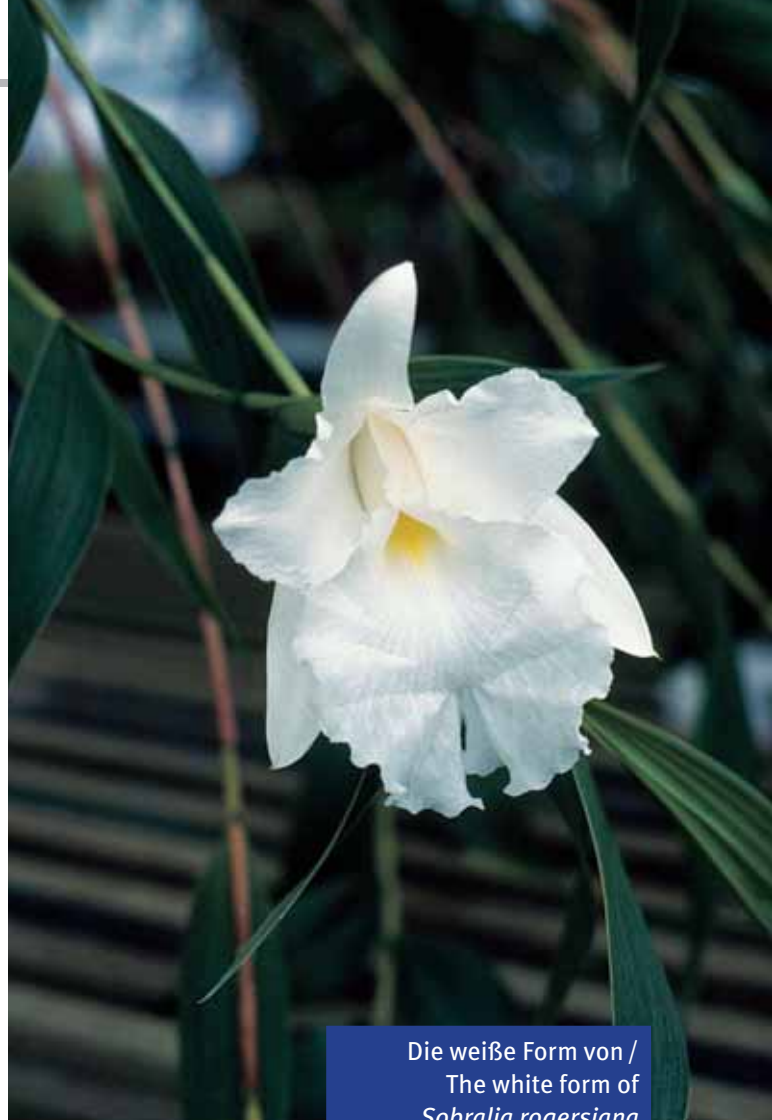
Die weiße Form von / The white form of Sobralia rogersiana Züchter / grower: RBG Kew

Etymology: Named for San Francisco Bay area Sobralia enthusiast and hybridist Bruce ROGERS who provided the type specimens.