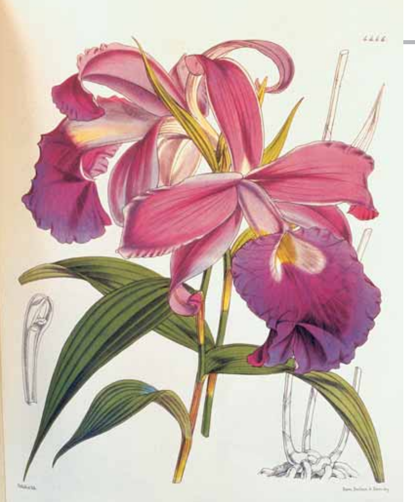
Sobralia rogersiana Abbildung aus / illustrated in the Botanical Magazine (als / as Sobralia macrantha , t. 4446).